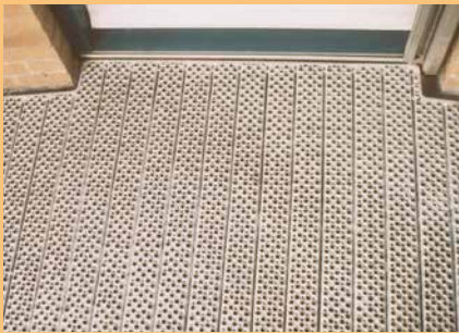
Naadloze aansluiting bij de drempel