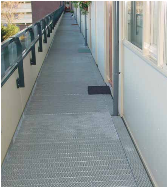
Verhoogde galerijvloer met uitneembare strook